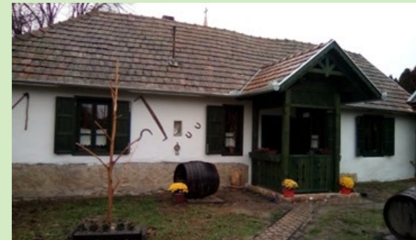
A múlt őrzője a nemrég elkészült Értéktár-ház

- Március végén szeretnénk volna köszönteni településünk hatvan év feletti lakóit, de sajnos a kialakult járványhelyzet miatt a rendezvényt el kellett halasztanunk. Jó pár olyan eseményünket is kénytelenek vagyunk elnapolni, amelyeket az év első felére terveztünk.