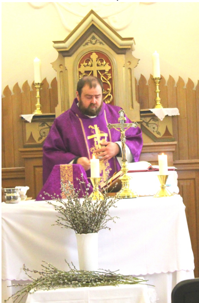
Szent Anna Templom