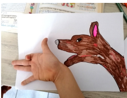
Telek Rita, 2. o. Kéz rajz