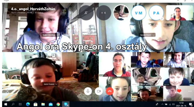
Angol óra Skype-on 4. osztály