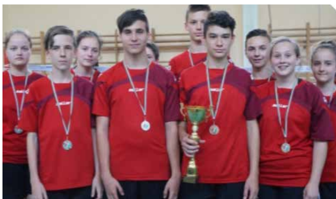
Lelkes csapatunk a Lengyel Lajos Emléktornán